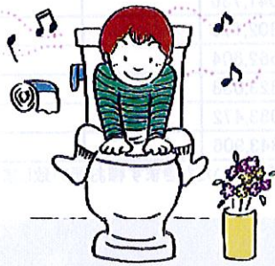
トイレの改装・改築に