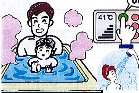
浴室ユニットバスの入れ替えに