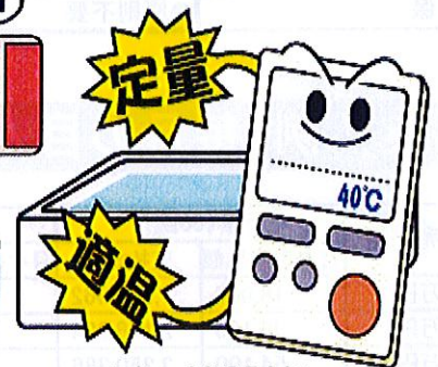
エコキュートシステムに