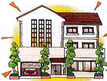
外装の補修・屋根の吹き替えに