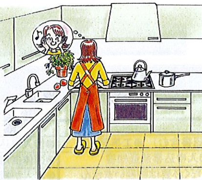
システムキッチンの入替え・DKの改装に